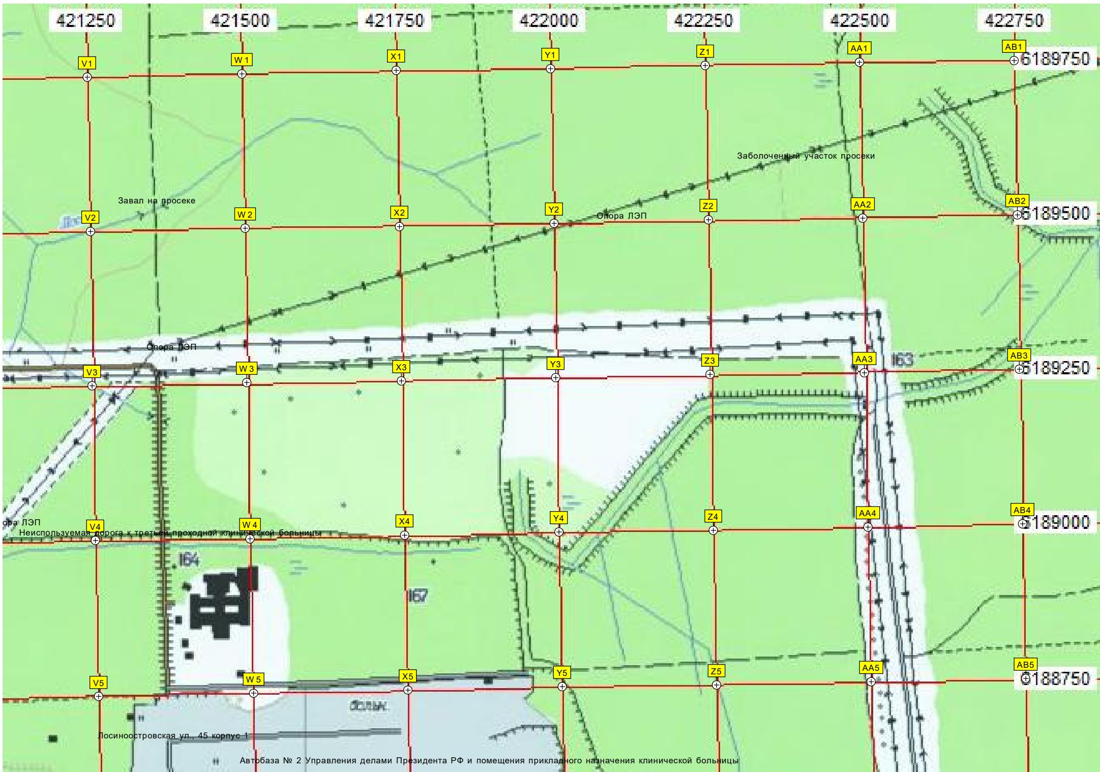
Автобаза № 2 Управления делами Президента РФ и помещения прикладного назначения клинической больницы